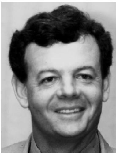
Vital Severino Neto Presidente do Comitê Paraolímpico Brasileiro

O Atlas do Esporte é uma publicação que fazia falta na bibliografia nacional. Nunca houve em momento algum de nossa vitoriosa, porém tantas vezes pouco divulgada história esportiva, uma iniciativa desta natureza. Algo que sozinho congregasse tanta informação pertinente, tanta densidade e fidedignidade. Para atletas, dirigentes e principalmente para nós gestores públicos do esporte, o Atlas configura fonte indispensável de pesquisa, de informações básicas para postulação de propostas e confecção de programas, para justificativas de ações e correções de rumo. Eu, em nome do Fórum Nacional de Secretários e Gestores Estaduais de Esporte, recomendo veementemente o seu uso. Sua publicação bilíngüe e em meio eletrônico permite que sua amplitude seja ainda maior e que aquilo que faz parte da nossa cultura esportiva esteja ao alcance de, literalmente, todo o mundo. Espero que este Atlas possa permanecer vivo e que suas futuras edições continuem a contribuir de maneira decisiva nos rumos do esporte nacional. Aos colaboradores deixo minha mais profunda admiração pelo extenso trabalho. Aos leitores, meu desejo que este compêndio possa servir de referência privilegiada e de leitura não só informativa, mas também prazerosa. Bons ventos!