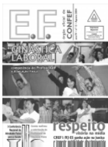
Informação aos profissionais para uma identidade comum

Todo esse elenco de informações permite entrelaçar os dados e estabelecer inúmeras conclusões que, agora sim, baseado em elementos concretos, estabelecer Políticas Públicas, inclusive, traçar projetos, programas e ações que contemplem as reais necessidades da sociedade, fazer uso devido dos recursos existentes, estabelecendo as prioridades em conformidade com as necessidades. O objetivo, plenamente atingido, foi o de oferecer a oportunidade para o legislativo, em que se situam os atores principais da área; os gestores, os formadores profissionais, a mídia; em suma, todos aqueles que de alguma forma têm envolvimento com as atividades físicas, possam deixar de atuar de forma improvisada, e planejar pautados em dados concretos.